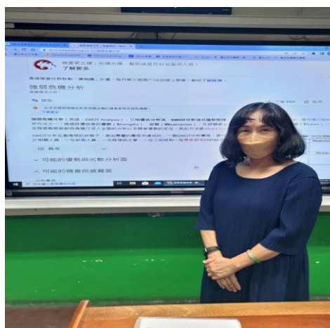
與商業概論教師進行協同教學，介紹 SWOT 模式