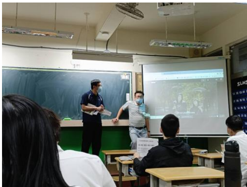
協調閩南語教師運用影片進行協同教學