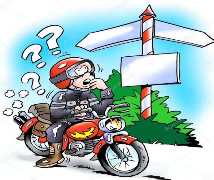
(附件三：第一堂課的課堂成果)