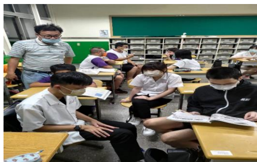
教師參與學生的小組討論(暖身活動)