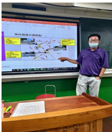
和學生介紹學校週邊路口