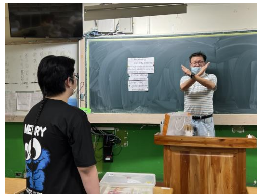
同學回答影片中的錯誤