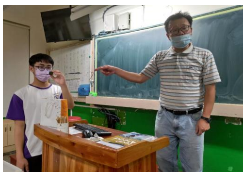
答對的同學至臺前抽取得分球