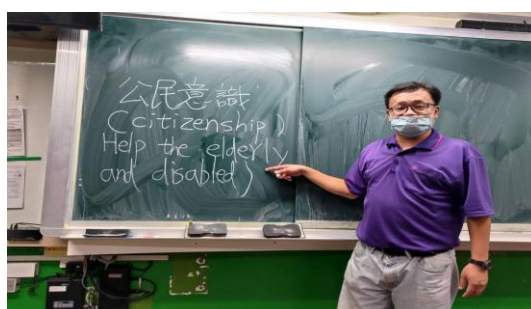
教師補充說明「公民意識」