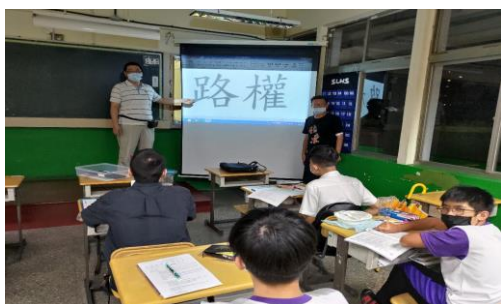
協調生活與法律老師做協同教學