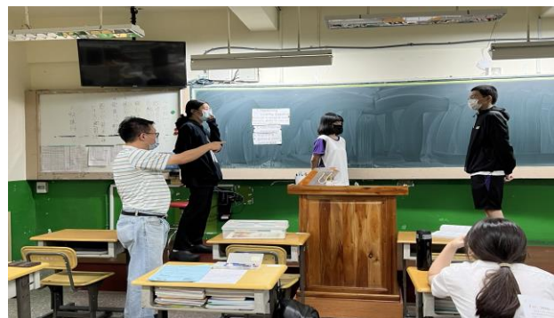
教師引導同學現場演出